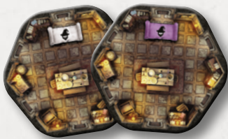
Маркеры с розой (12)