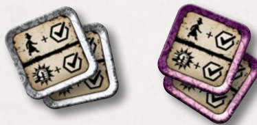
Фишки урона/нестабильности (50)