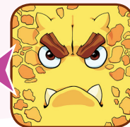
Пример 4: Получение карточек

Если никто из игроков не угадал правильно