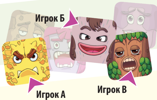
Пример 3: Угадывание монстра

Остальные игроки одновременно пытаются угадать, какого монстра показывает мим, и накрывают ладонью соответствующего монстра (смотрите пример 3).