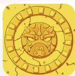
Секретные карточки монстров

Секретные карточки монстров отличаются от карточек монстров оборотом.