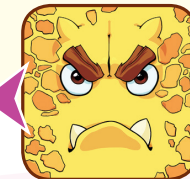
Пример 5: Убираются 2 карточки

Показываемая мимом карточка убирается из игры